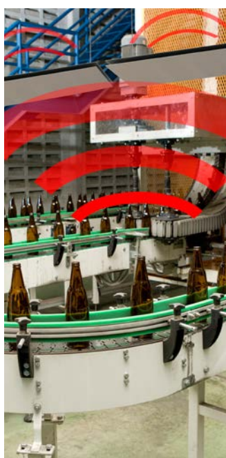
Schematische Darstellung der Schallabsorption mit SonoPerf ▲