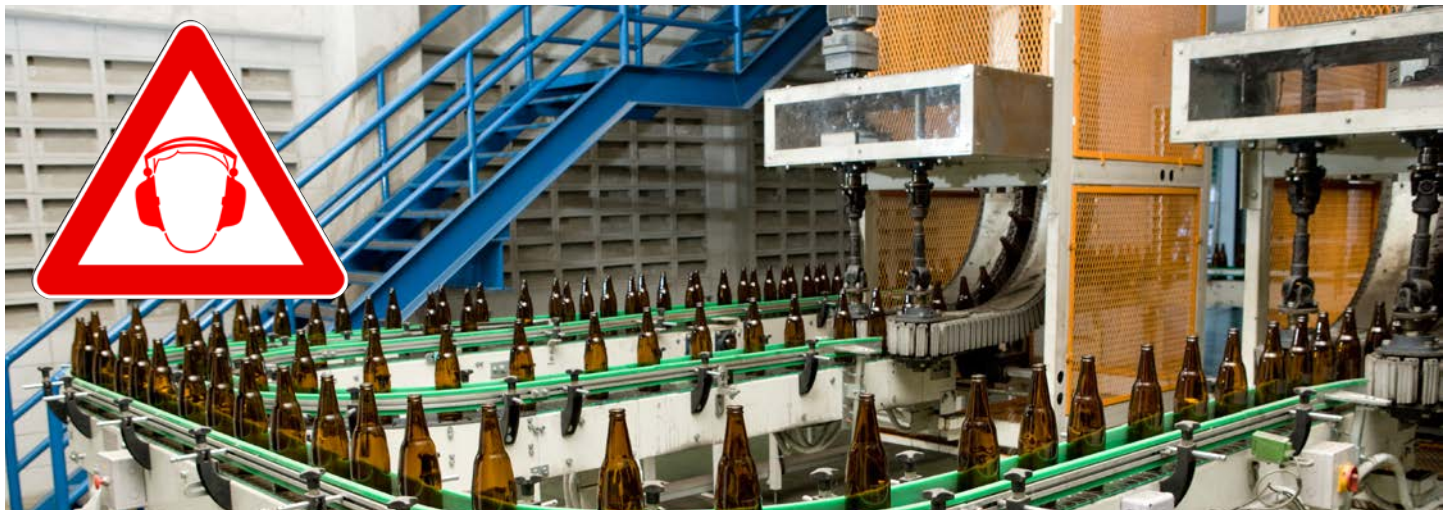
▲ Beispiel für ein lautes Arbeitsumfeld unter hygienischen Bedingungen