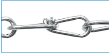
Knotenketten nach DIN 5686 Knotted chains according to DIN 5686

Our range is dedicated to agricultural and special purpose machines, hence we are able to offer tailor made products.