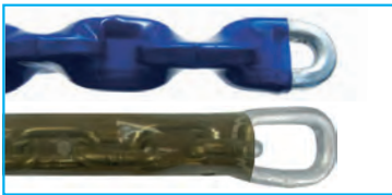
PVC - ummantelte Ketten PVC - coated chains

Auch in Dickschicht passiviert mit/ohne T2-Versiegelung lieferbar. Also available in thick-film passivated with/without sealing T2.