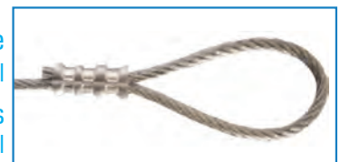
Drahtseile Stahl verzinkt und PVC - ummantelt, Edelstahl Wire Ropes Steel zinc plated and PVC - coated, Stainless Steel